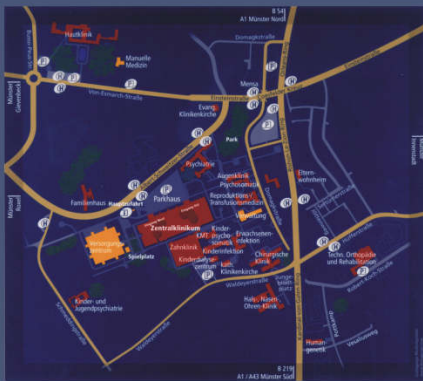
a Münsteri klinika térképe